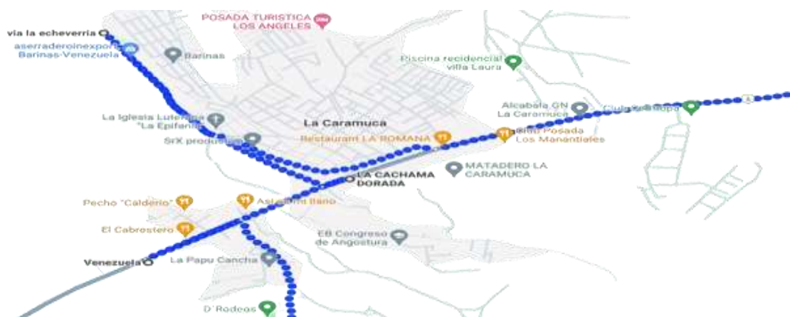
Figura 2. Propuesta de la producto turístico agroecológico “La Travesía La Echeverría Tour” parroquia Manuel Palacio Fajardo.