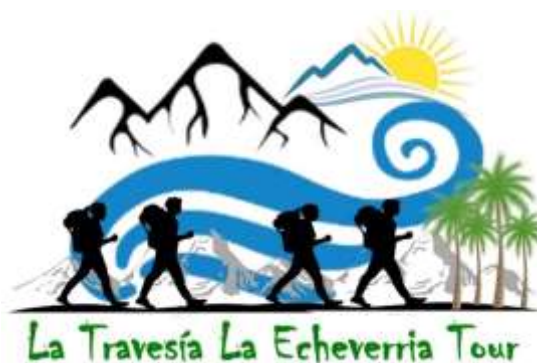
Figura 3. Imagen de la Propuesta de la producto turístico agroecológico “La Travesía La Echeverria Tour” parroquia Manuel Palacio Fajardo.

Asimismo, luego de vivir una experiencia turística agroecológica donde pudieron aprender las técnicas de siembra de musáceas, preparación de la tierra para el Maíz, la degustación de dulces típicos y un rico almuerzo en el Restaura La Cachamita Dorada. Asimismo, visitar los centros turísticos recreativos realzando caminatas, juegos deportivos, piscina y