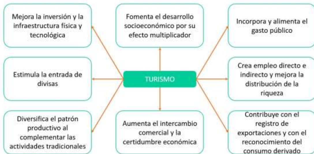
Figura 2: Contribuciones del turismo desarrollo local.

Por lo tanto, la actividad turística impactará positivamente en los lugares, en su desarrollo económico y en la calidad de vida de las personas. Si bien puede generar aspectos negativos que influirán directamente en la población local (alta dependencia de la actividad turística, aumento de precios, degradación del espacio y contaminación), los cuales, con una adecuada planificación, pueden atenuarse o evitarse, se observa en el siguiente esquema los puntos de contribución que realiza el turismo.